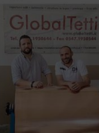
SOCI Taibi e Sutera

«Con gli incentivi per la ristrutturazione il mercato non è fermo, inoltre molte imprese del settore hanno chiuso e c'è spazio per chi ha voglia di imporsi».